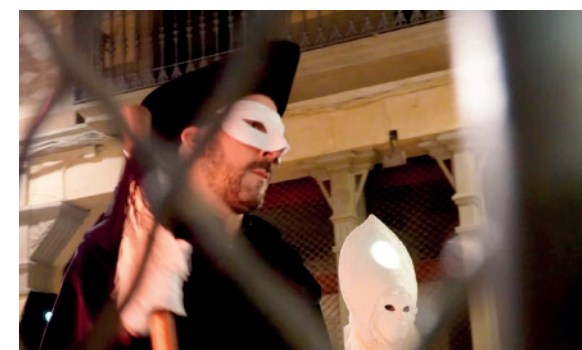
Virtut presonera