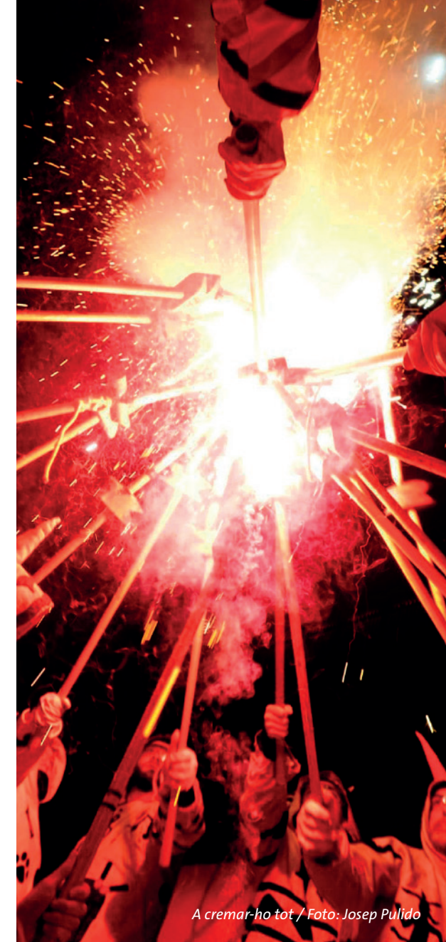
A cremar-ho tot