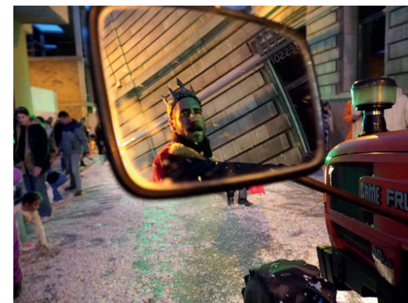
És el Rei?