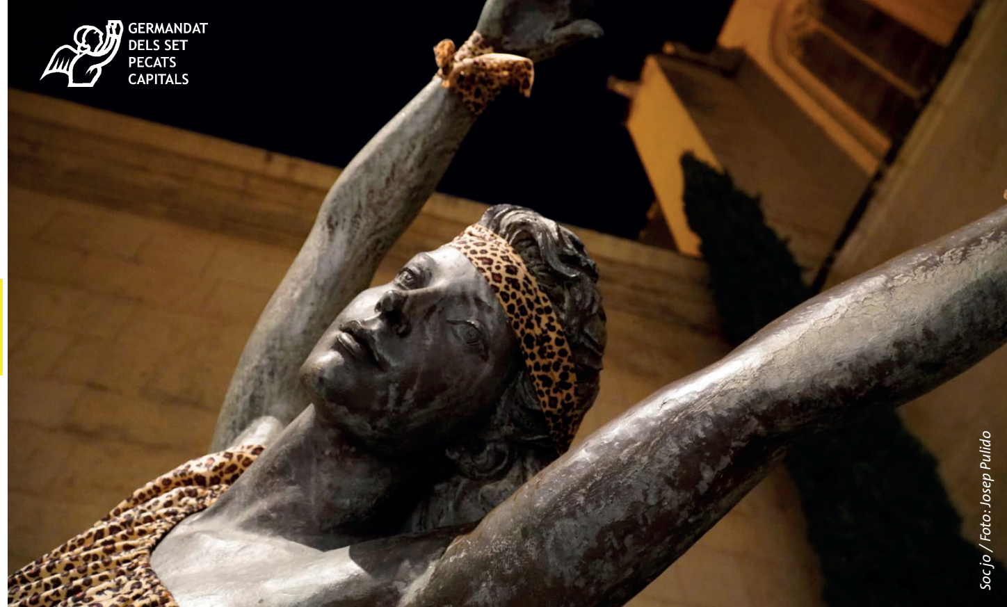
Soc Jo