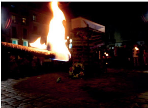
Foc a punt

Estem convençuts, i així es denota en les instantànies que hi ha exposades, que aquesta visió externa és, a grans trets, molt semblant a la visió interna, però aporta una perspectiva visual més espontània i fresca, que ens ha permès veure elements que, per a les persones que fem la festa, ens havien passat desapercebuts.