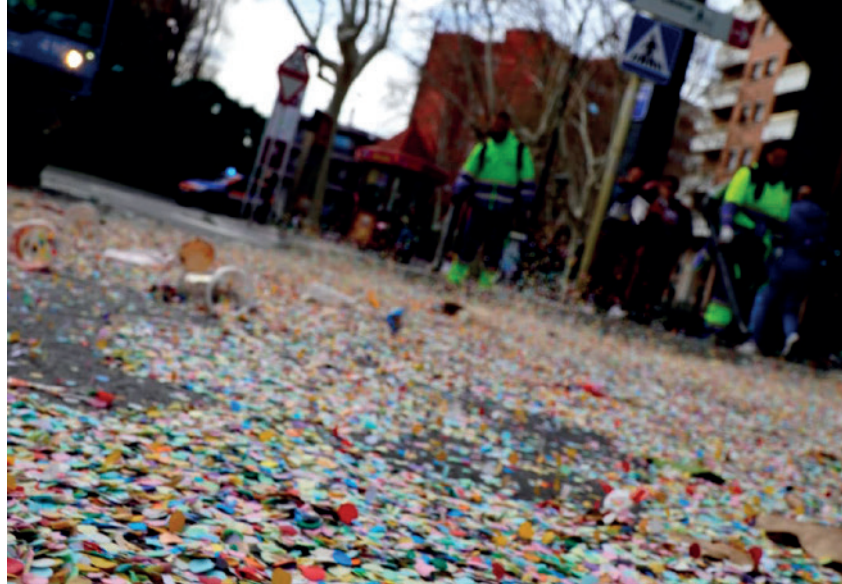
Quina feinada / Foto: Josep Pulido