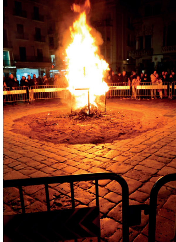
El foc

Des de la Germandat dels Set Pecats Capitals volem donar les gràcies a en Josep Pulido pel seu interès i predisposició a l'hora d'organitzar i muntar aquesta mostra fotogràfica.