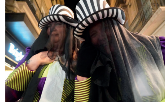
Quina tristor

VISCA EL CARNAVAL DE REUS! GERMANDAT DELS SET PECATS CAPITALS