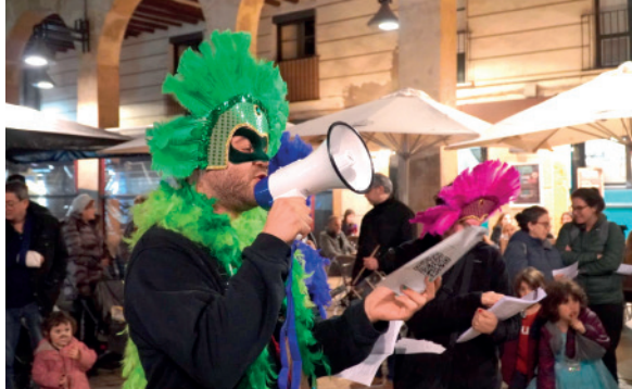
Cantant Cantaval

Des de la primera mostra fotogràfica, per allà l'any 2006, hem intentat reflectir la festa del carnaval reusenc des d'una perspectiva interna, com a participants de la festa amb la voluntat de donar a conèixer com es viu i es gaudeix cadascun dels dies.