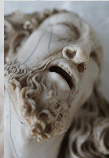
Cap girat cap a l'esquerra amb el coll estirat. Boca oberta amb dents i llengua. Ulls mirant enlaire i pupil·la foradada.