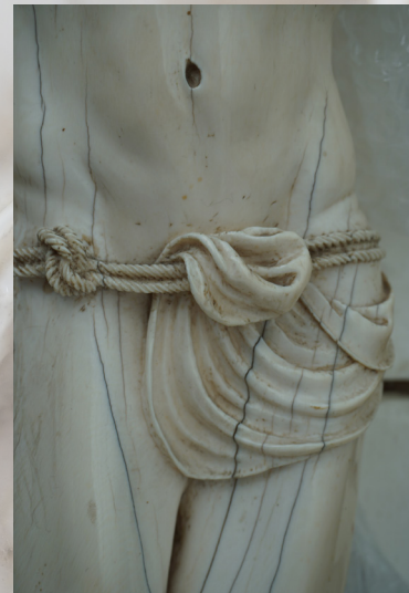
Pany de puresa aguantat amb un cinturó de doble corda lligat al maluc.