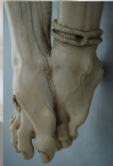
Peu esquerre amb una doble corda al turmell.