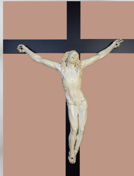
Cos amb una lleugera inclinació cap a la dreta respecte les cames.

L'execució tècnica i els detalls escultòrics són d'una extremada riquesa i virtuosisme.