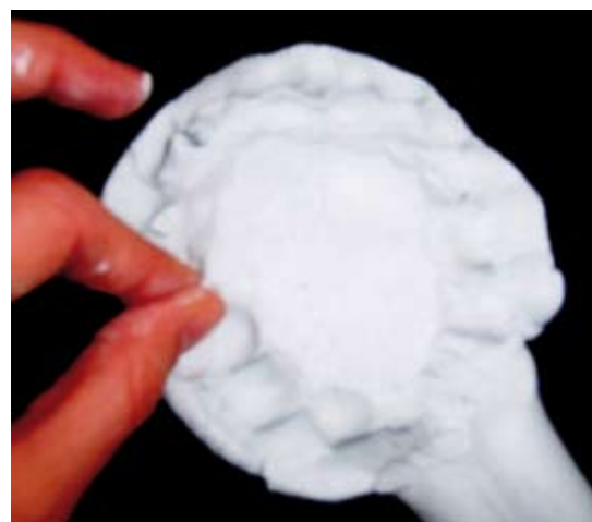
Acció de pessigar el fang per tal de formar el cabell de l'escultura