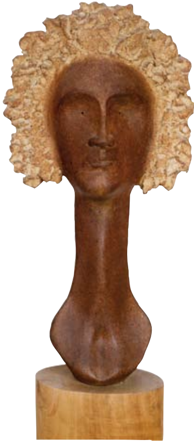
Autor: Ramon Carreté Títol: Cap de dona Tècnica: Material refractari modelat