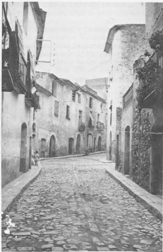
Carrer de Baix (foto retrospectiva).