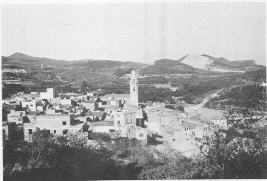
Vista del poble.