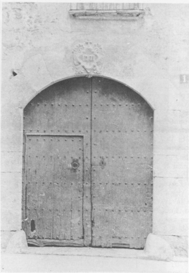
Portalada de Cal Barenys (1771). Avui no existeix.