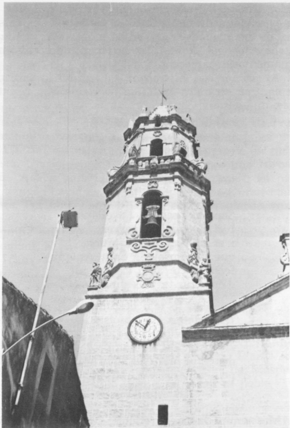
El campanar des del Replà.