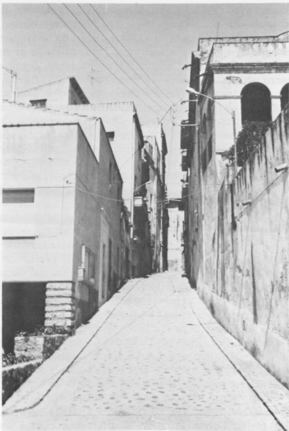
Carrer de la Botiga, on es pot apreciar el pendent.