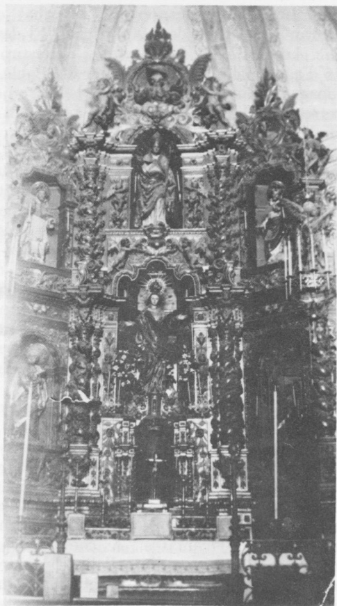
Retaule Barroc de l'Església, destruït l'any 1936.