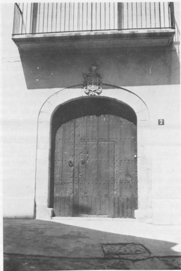
Portalada de Cal Pujol.