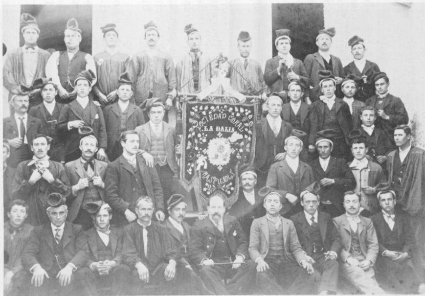
L'Agrupació Coral «La Dàlia».