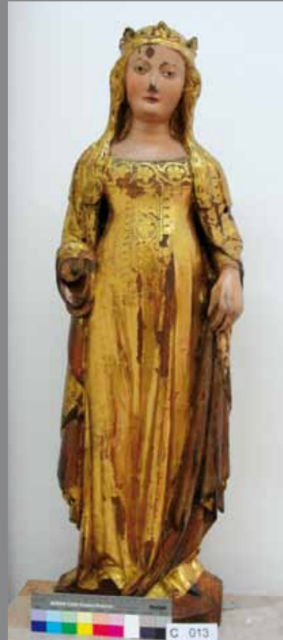
Santa Margalida o Santa Caterina