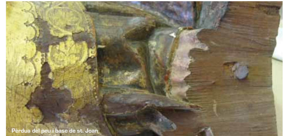
Pèrdua del peu i base de st. Joan

La principal alteració que afectava les obres i per la qual calia intervenir eren els despreniments puntuals de l'estrat pictòric, ocasionats per les condicions ambientals inadequades. Altres problemes observats eren la presència d'orificis produïts pels insectes xilòfags, sense una activitat aparent, escletxes, brutícia general i oxidació dels claus de forja.