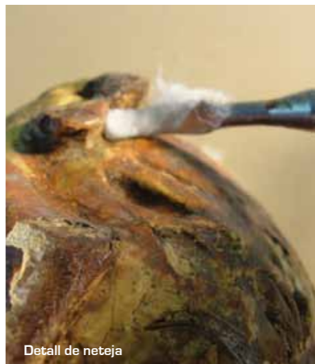
Detall de neteja