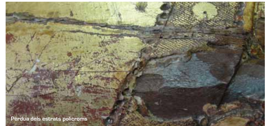
Pèrdua dels estrats policroms

Fixació dels aixecaments dels estrats pictòrics i daurats, mitjançant la filtració de resina acrílica i vinílica. Estucat puntual als contorns de les llacunes per proporcionar estabilitat i prevenir futurs despreniments.