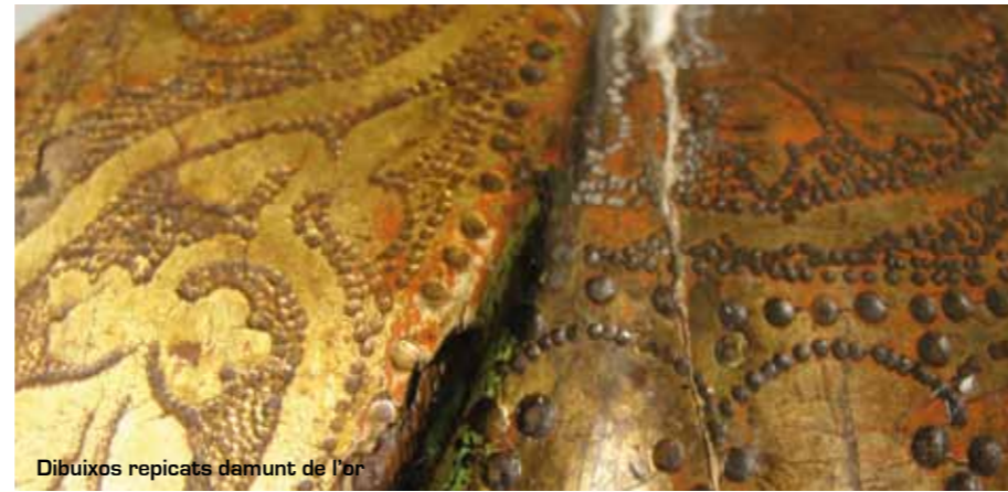
Dibuixos repicats damunt de l'or

Les escultures són exemptes, tallades en fusta de pi, daurades amb full d'or fi brunyit i plata fina (només a l'atribut de sta. Magdalena), i policromia a les carnadures. Amiden aprox. 85 X 23 X 24 cm.