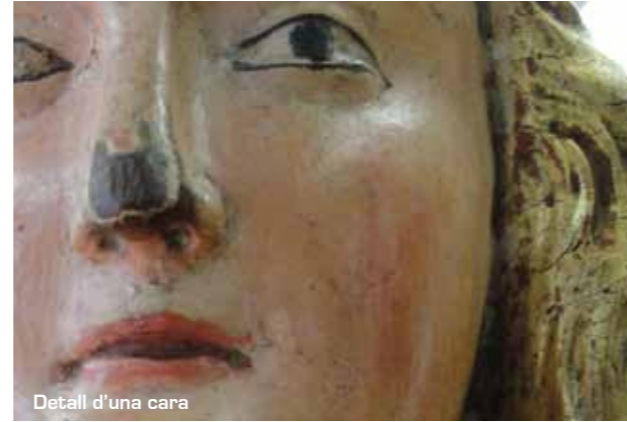
Detall d'una cara

Actualment les imatges restaurades formen part del fons del Museu catedralici, tot i que procedeixen del retaule major de la Mare de Déu de l'Estel de la catedral de Tortosa. Un políptic magnífic, exemple de l'art gòtic català amb influència italiana, construït al 1351 per possiblement l'anomenat Mestre de Tortosa.