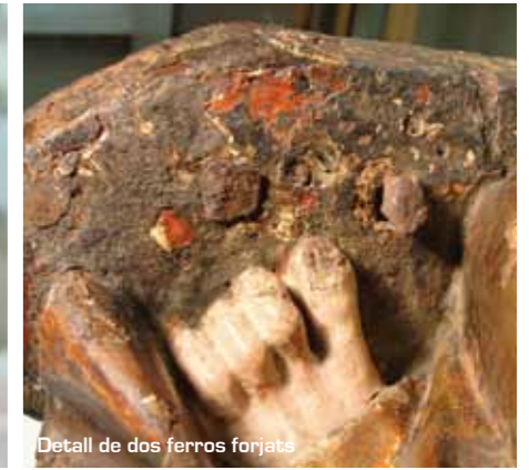
Detall de dos ferros forjats

La principal alteració que afectava les obres i per la qual calia intervenir eren els despreniments puntuals de l'estrat pictòric, ocasionats per les condicions ambientals inadequades. Altres problemes observats eren la presència d'orificis produïts pels insectes xilòfags, sense una activitat aparent, escletxes, brutícia general i oxidació dels claus de forja.