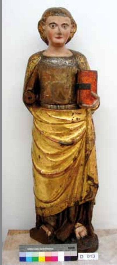
Sant Joan Evangelista

RETAULE DE LA MARE DE DÉU DE L'ESTEL Catedral de Tortosa