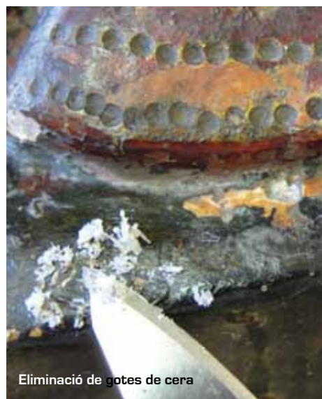
Eliminació de gotes de cera

Aplicació general de vernís mat en esprai.