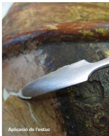
Aplicació de l'estuc