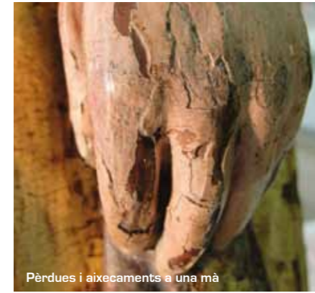
Pèrdues i aixecaments a una mà

L'estat de conservació general de les obres era regular-deficient, tenint en compte que les imatges ja havien estat intervingudes en diverses ocasions: repintats parcials al 1546, neteges als segles XVII i XIX, restauració de tot el retaule del 1983 al 1988 pel CRBMC.