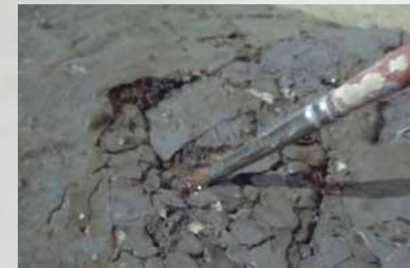
Aplicació d'adhesiu per fixar la policromia

Aquest procediment va consistir en l'aplicació de cola animal calenta, amb pinzell sobre les disgregacions i amb xeringa sobre els aixecaments de les capes de preparació i / o de capa pictòrica, i aplicació de pressió en els casos en què va ser necessari.