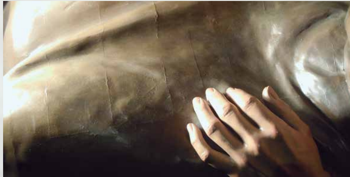
Moviment dels blocs de fusta a través de la policromia

Els suports es trobaven en bones condicions. El fet que les imatges es construïen mitjançant l'acoblament de diferents blocs de fusta comporta que aquestes unions es moguin després del pas del temps, però no significa estrictament un deteriorament. En aquest cas, es podien observar les unions dels elements a través de la policromia.