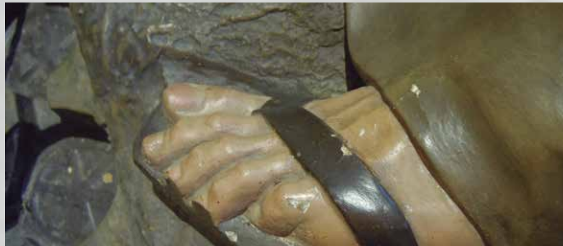
Despreniments de capa de preparació i policromia

En relació amb la brutícia superficial, el pas presentava dipòsits superficials en forma de pols ambiental i alguna taca d'humitat i excrements d'insectes.