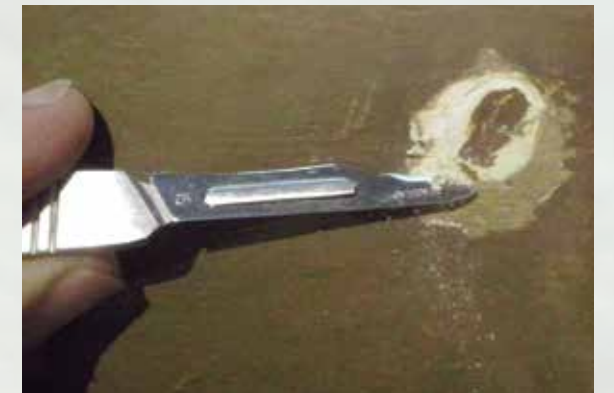
Eliminació d'intervencions anteriors

S'hi van eliminar únicament les repintades i massillats que més dificultaven la visió del misteri o que perjudicessin l'estabilitat de l'obra. La remoció es va fer amb isopropanol i, mecànicament, amb bisturí.