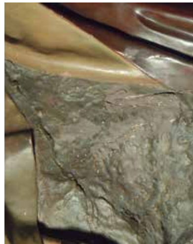
Repintades sobre la policromia anterior

Segons l'estudi visual, es pot concloure que l'obra es va realitzar amb la tècnica a l'oli. Més endavant, algunes figures van ser totalment repintades, en alguns casos canviant el color de l'hàbit. Posteriorment, es van fer nous massillats i repintades puntuals, probablement en diferents èpoques, per intentar dissimular nous desperfectes. Per tant, el que es veu en l'actualitat poc té a veure amb la policromia original de l'obra.