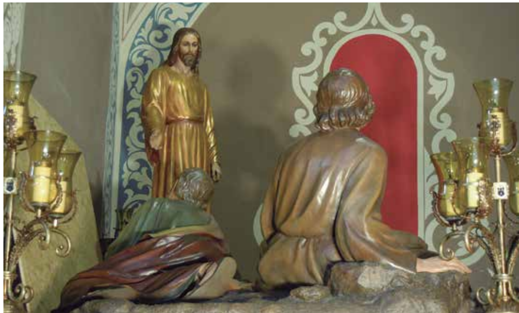
Mysteri abans de la intervenció

El Misteri de Setmana Santa “ Vetlleu i Pregueu ” de l'Associació La Salle de Tarragona fa referència al moment en què Jesús torna de l'oració a l'hort i troba que els seus deixebles s'han adormit. El pas consta de quatre talles de fusta que representen a Jesús, dret, adreçant-se als seus deixebles, Jaume, Joan i Pere, en una actitud serena.