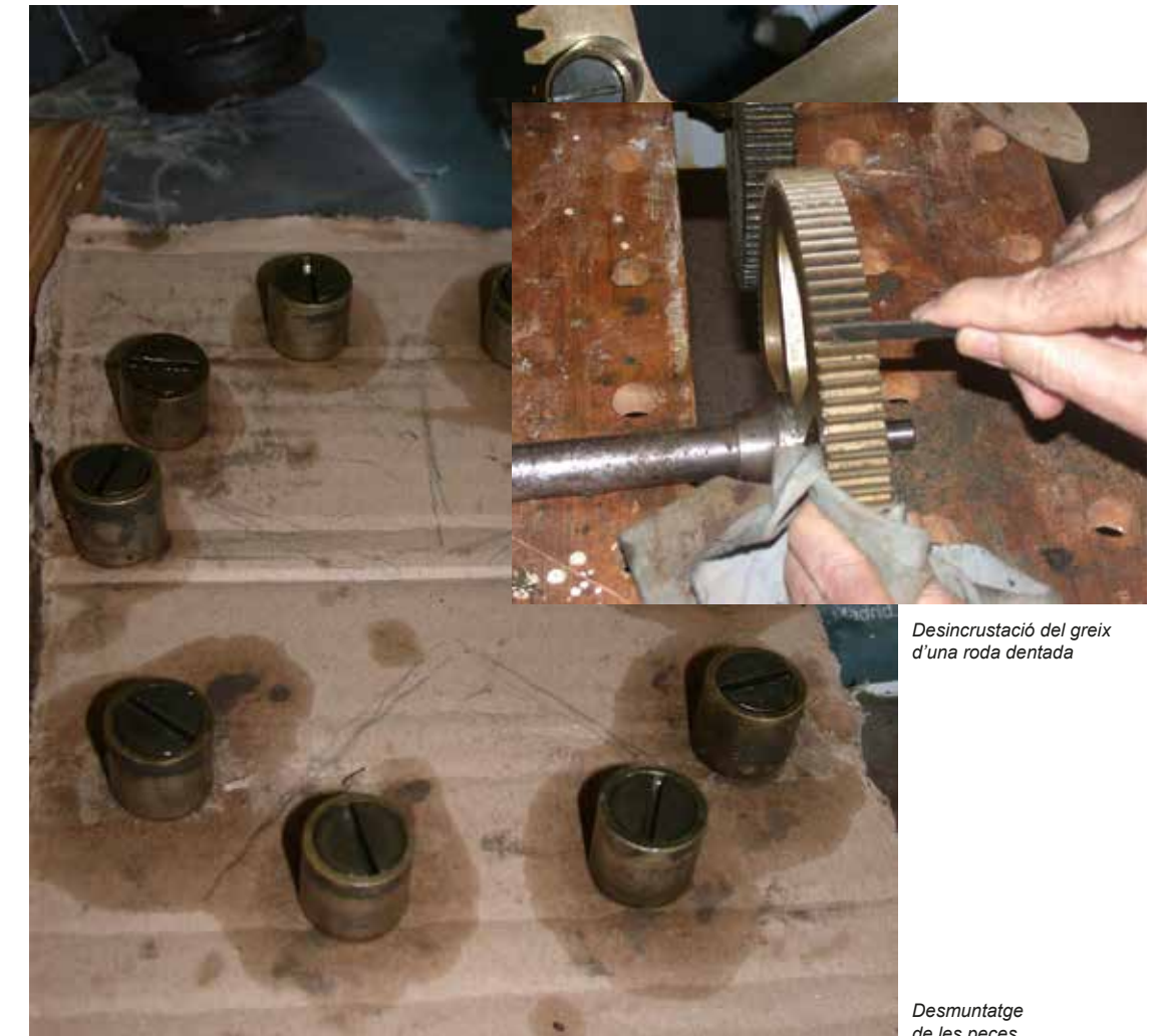
Desincrustació del greix d'una roda dentada

La fusta de la taula es va desinsectar de forma preventiva amb productes químics, i s'hi aplicà una capa de protecció.