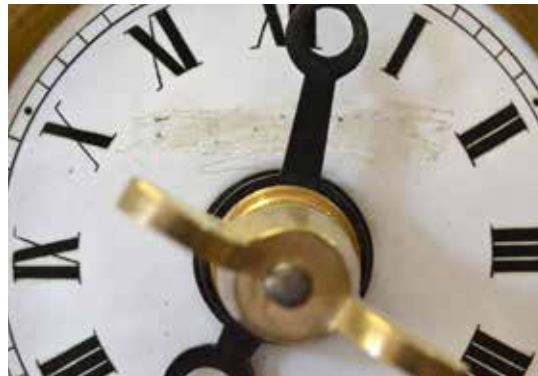
Detalls de l'esfera de la maquinària: Lletres rascades

Els engranatges, rodes dentades, eixos i altres elements de la maquinària estan construïts amb bronze, llautó i acer. Al centre de l'estructura destaca una petita esfera esmaltada amb el nom de la localitat: Roquetes . A la part superior s'observa la superfície ratllada en el lloc on hi havia originalment la llegenda Talleres Cronos .