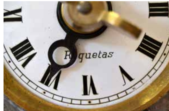
Nom de la població

Els pesos del rellotge, que possibiliten el moviment de la maquinària juntament amb l'oscil·lació del pèndol, són de ferro i pegen d'una cadena, que té la llargària doblada en relació amb l'alçada del campanar.