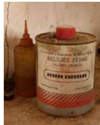
Pot d'oli elaborat per Talleres Cronos