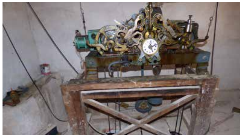
El rellotge in situ abans de la intervenció

Cal esmentar que el rellotge porta un motor, probablement incorporat després, per remuntar automàticament la cadena del rellotge. Actualment funciona correctament.