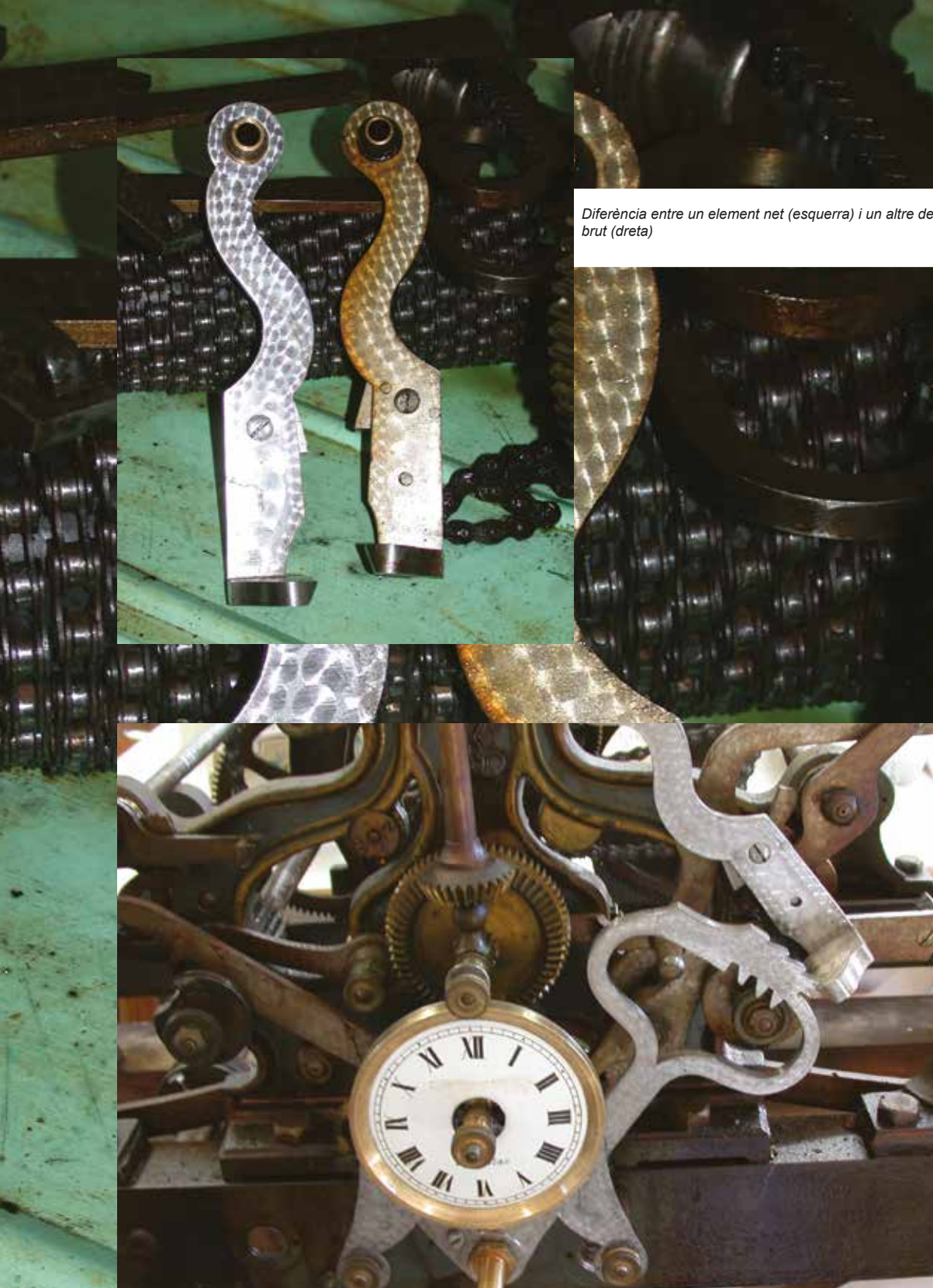
Diferència entre un element net (esquerra) i un altre de brut (dreta)