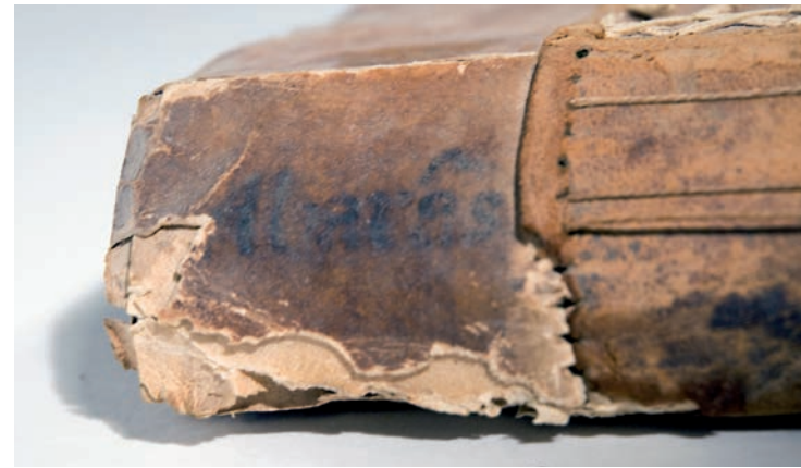
Danys dels rosegadors al llom

El pergamí es mostrava arrugat i deshidratat. Mancava matèria als plans i als reforços de cuir per l'atac d'insectes i rosegadors. La solapa de la cartera patia una severa deformació que no permetia tancar el llibre correctament. Les llaceries es trobaven en un estat delicat i fins i tot trencades a causa del fregament amb altres llibres.