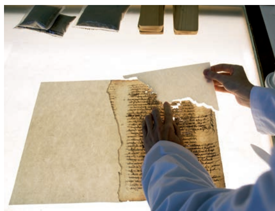
Reintegració de pèrdues causades pels rosegadors

Les galeries d'insectes i zones perdudes per causa dels rosegadors es van reintegrar amb paper japonès i midó.