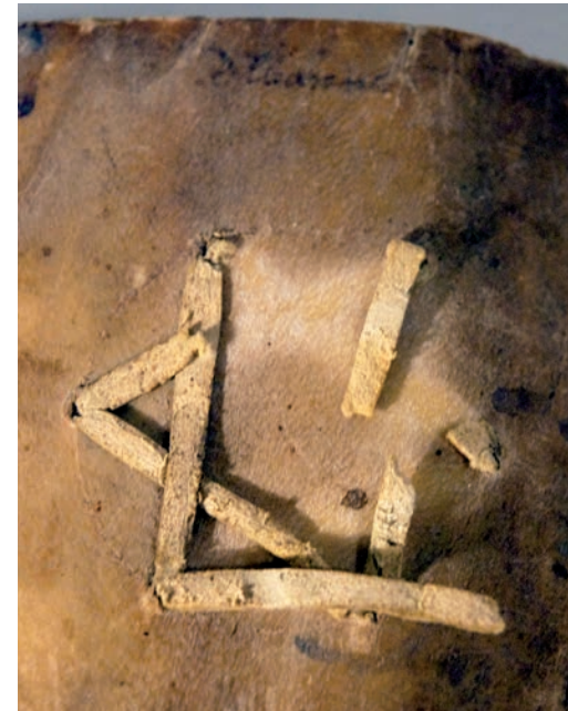
Estat fràgil de les llaceries

Element sustentat: les tintes ferrogàliques estan fetes d'una barreja d'agalles de roure, caparrós, un aglutinant i un dissolvent. La seva composició química està constituïda per àcid tànic i sulfat de ferro, elements molt reactius amb l'oxigen i, sobretot, amb la humitat ambiental.