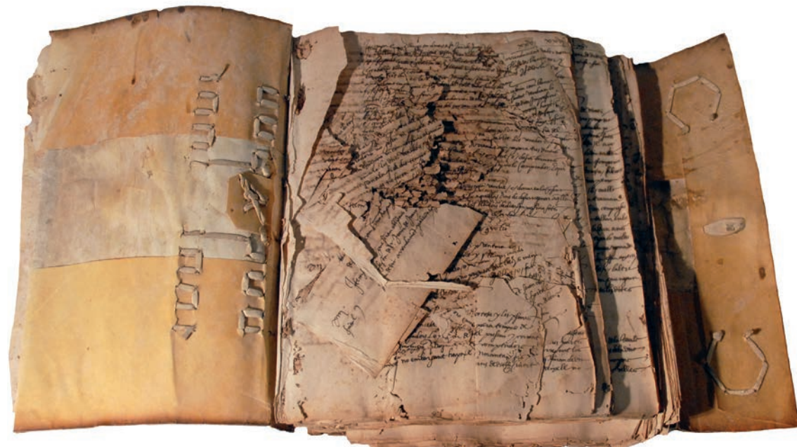
Aspecte del llibre abans de la restauració

La peça és propietat de l'Ajuntament de Tortosa i es guarda custodiada a l'Arxiu Comarcal de les Terres de l'Ebre. Pertany a la col·lecció històrica de llibres seriatos municipals i el seu contingut recull els acords sobre l'arrendament del cobrament de gravàmens de diferents mercaderies a la ciutat de Tortosa: carns, farines, aviram, mel, sabons... i també els impostos ("imposicions") que les confraries locals estaven obligades a pagar.