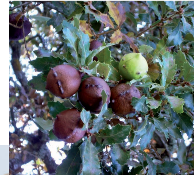
Agalles de roure

Amb el pas del temps, les tintes d'aquesta naturalesa es van deteriorant fins a generar àcid sulfúric, que produeix una forta baixada del pH al suport (acidesa del paper). D'altra banda, els compostos solubles de l'element ferro contribueixen a l'oxidació de la cel·lulosa.