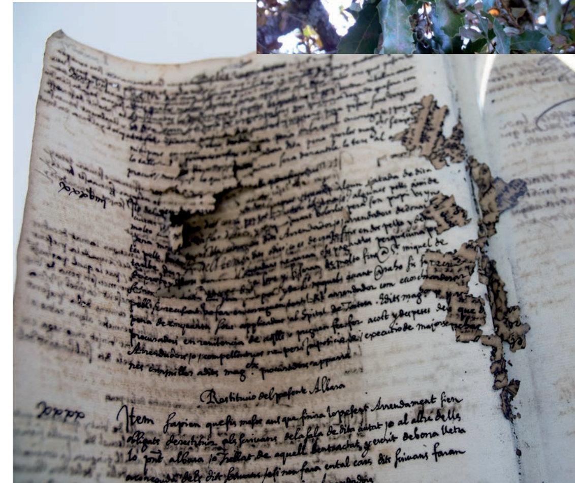
Danys causats per les tintes ferrogàliques