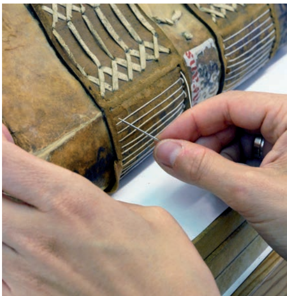
Procés del cosit