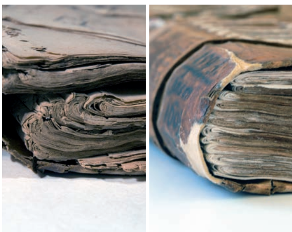
Bloc del llibre, abans i després de la restauració