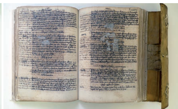
Portada i interior del llibre, després de la restauració