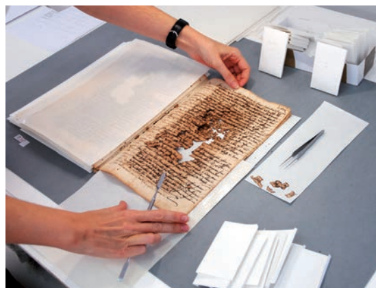
Desmuntatge i ordenació de fragments

Bifolis i fragments es van sotmetre a un procés de tres banys: el primer, amb aigua, per netejar la brutícia; el segon, amb fitats, una substància orgànica que atura l'activitat catalitzadora dels ions ferro i, finalment, una desacidificació amb bicarbonat càlcic, per aconseguir un pH adequat.