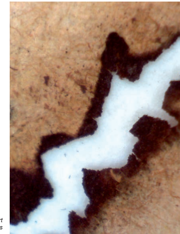
Estat ruïnós (55% del llibre): pèrdues físiques de suport causades per l'acció química de les tintes

La combinació dels fenòmens químics patits al suport per causa de les tintes -acidosa i oxidació- es tradueix en un trencament gradual del paper, que passa per diferents estadis fins a fragmentar-se totalment.