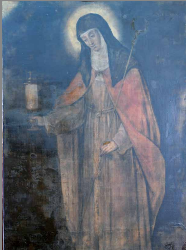
Mides 122 x 86 cm Pintura a l'oli sobre tela de lli Artista desconegut Època probable segle XVII