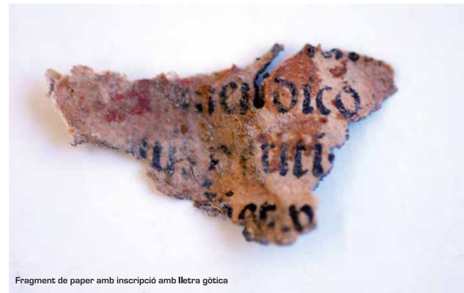
Fragment de paper amb inscripció amb lletra gòtica

La seva vestimenta és un hàbit amb un cordó lligat amb tres nusos, element que la vincula amb sant Francesc d'Assís, el qual li va lligar la corda i tallar el cabell com a acte d'iniciació per entrar dins l'ordre. El tocat que envolta la cara i el coll és blanc, cobert per un vel negre. La túnica i la capa són de colors foscos, una mostra de l'austeritat i la pobresa que caracteritza l'ordre de les clarisses.