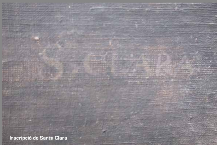
Inscripció de Santa Clara