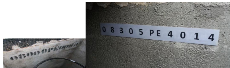
Exemples de rotulat interior de pericó

La ubicació correcta, serà en una de les parets sense entrada de tubs, centrada tant horitzontalment com verticalment i evitant que es tracti d'una zona de pas de cable o ubicació de elements de derivació i/o connexió. Prèviament la D.O. validarà la ubicació i correcte validació de la retolació.