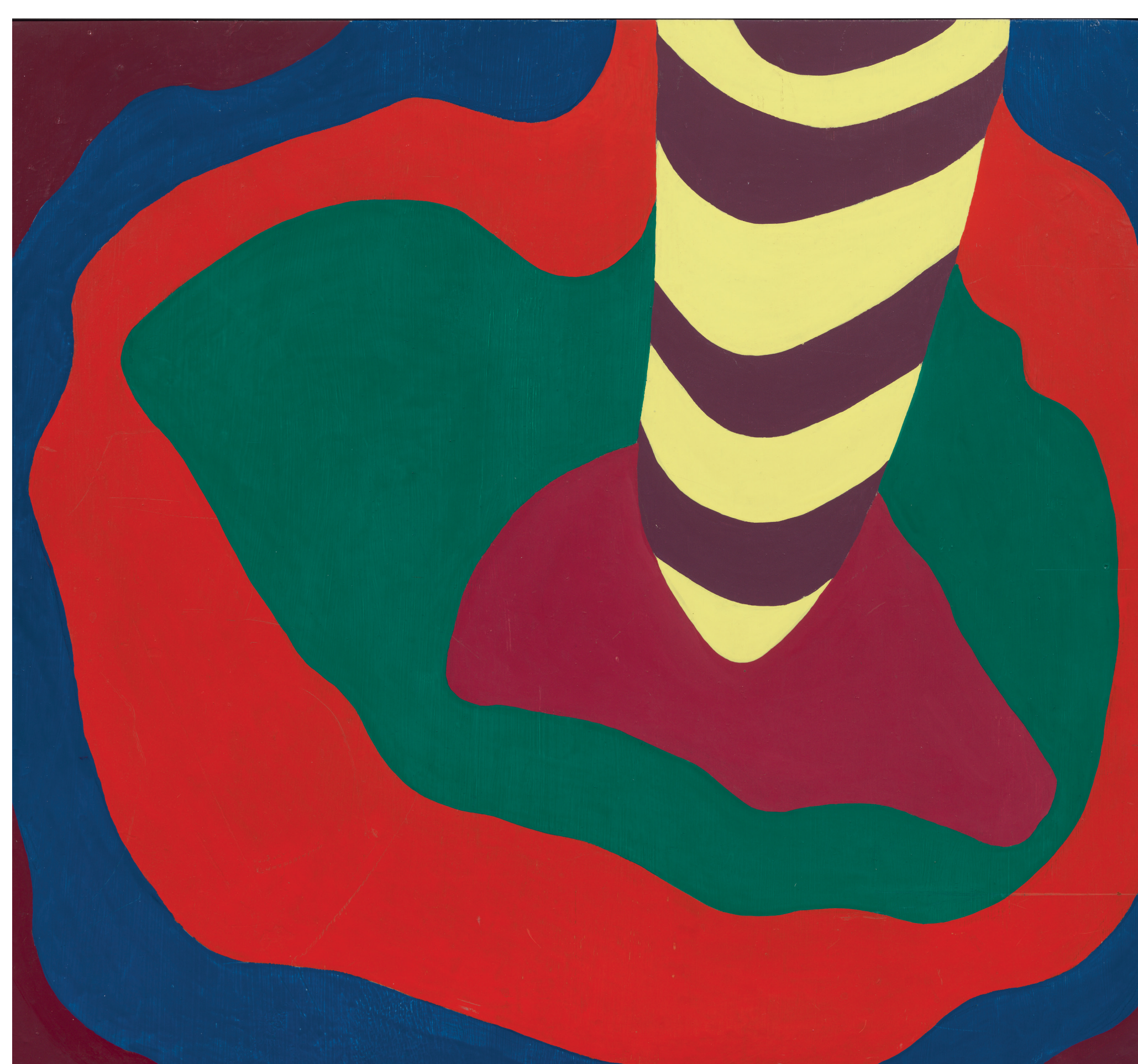
Coitus pop, 1968 Col·lecció MACBA. Fundació MACBA © Mari Chordà